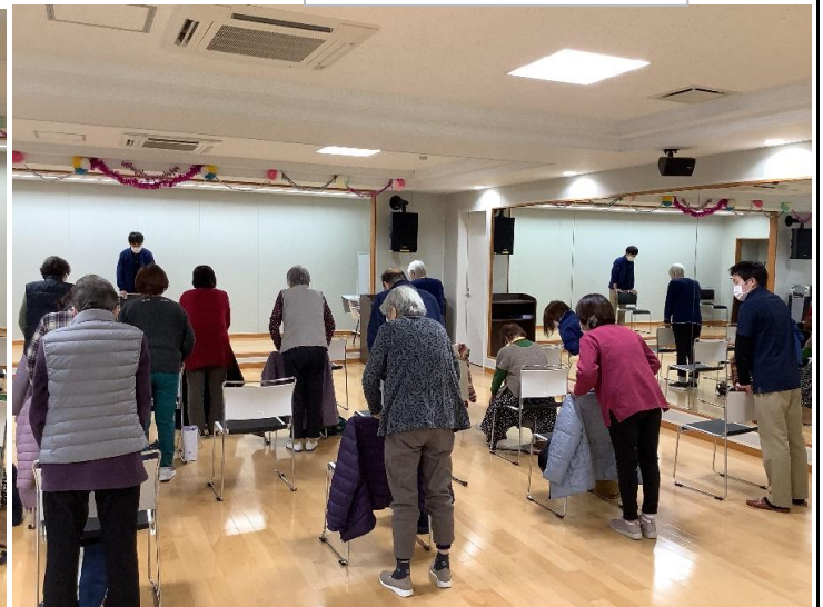
体幹を鍛えて腰痛予防